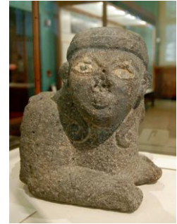
Amuq Valley, Tell Tayinat (Anatolie ) 1800-1100 avant J.C.)

Car j'ai, pour fasciner ces dociles amants, De purs miroirs qui font toutes choses plus belles : Mes yeux, mes larges yeux aux clartés éternelles !