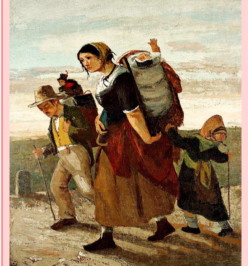
Gustave Courbet, la Bohémienne et ses enfants