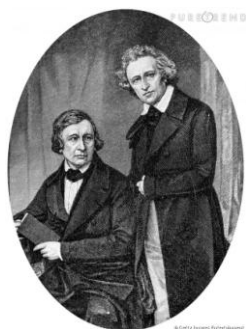
Les frères Grimm