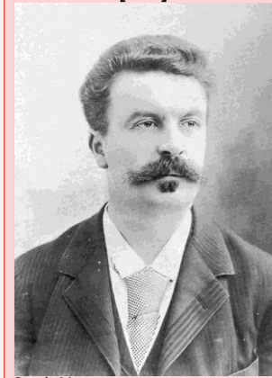
Guy de Maupassant