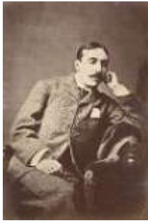
Eça de Queiroz

La préface au Mandarin constitue la réponse au rédacteur de la Revue universelle et elle est un manifeste en faveur de la liberté esthétique.