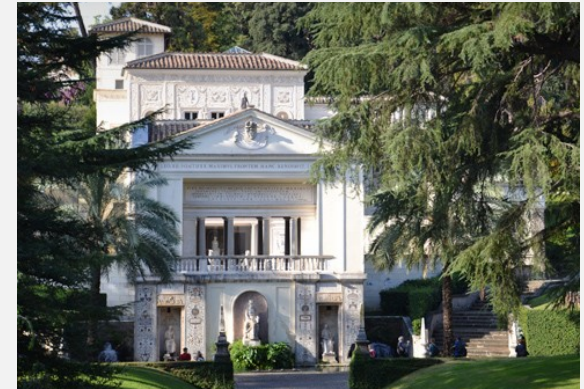
L'Académie pontificale des sciences, créée en 1936, regroupe 80 scientifiques, dont des prix Nobel.

La religion est-elle un obstacle à la science ?